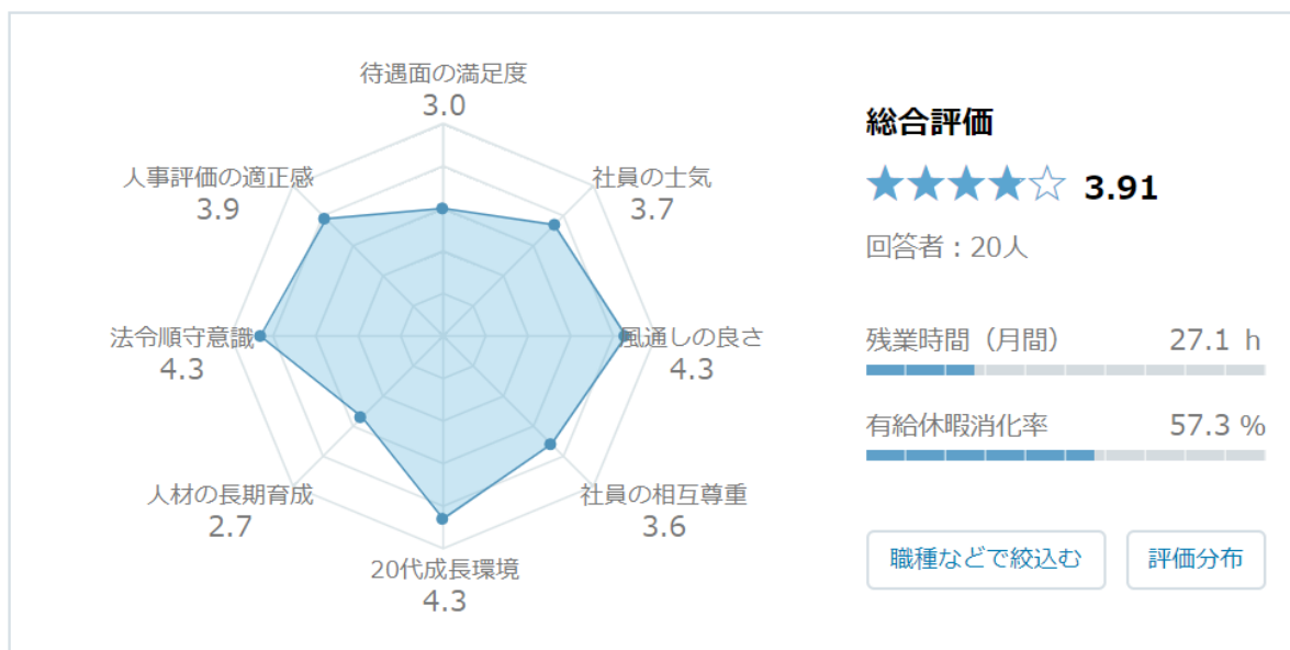
社員による会社評価スコア – GMOリサーチ株式会社

株式会社ヴォーカーズ「Vokers」より引用（2019年3月15日現在） https://www.vokers.com/company.php?m_id=a0C1000000IN4k5