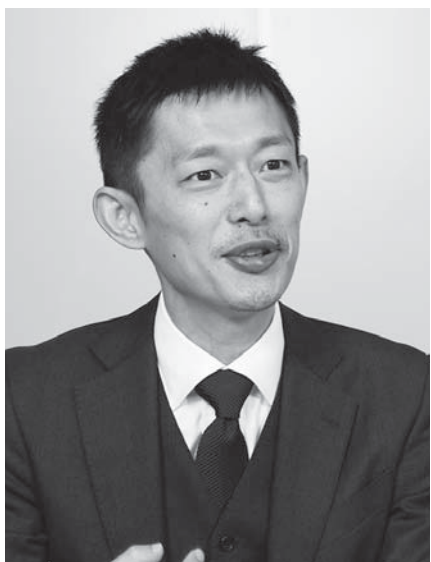
一般社団法人 日本マーケティング・リサーチ協会(JMRA) HRマネジメント委員会 働き方改革分科会