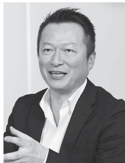
一般社団法人 日本マーケティング・リサーチ協会(JMRA)